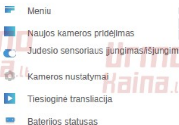
Pradinis programos langas